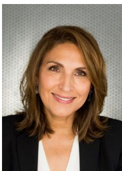
Docteur Nora Berra, ancienne Ministre Secrétaire d'Etat chargée des Aînés– Lyon (France)

Tout cela est-il possible désormais en France ? La réponse est que tous les outils pour respecter ces actions existent, mais il faut une meilleure organisation pour couvrir l'ensemble du territoire national et une formation de tous les professionnels de santé qui doivent être massivement impliqués dans cette politique de prévention.