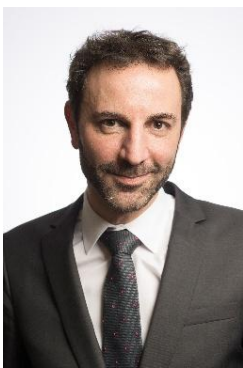
Renaud Villard, Directeur Général, Caisse nationale d'assurance vieillesse (CNAV) – Paris (France)

C'est en intégrant ces quatre dimensions, à grande échelle, que nous pourrons enfin transformer la médecine, passer d'un modèle de maladie à un modèle de santé, et démocratiser l'accès à une longévité en bonne santé.